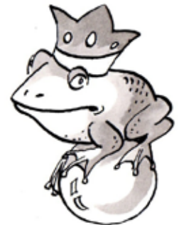
Illustration: Marlene Pohle

ab 07.30 Uhr Frühstück 09.30 Uhr Gottesdienst in der Hauskapelle 10.15 Uhr Abschlussrunde und Reflexion 11.45 Uhr Mittagessen, anschließend Heimreise